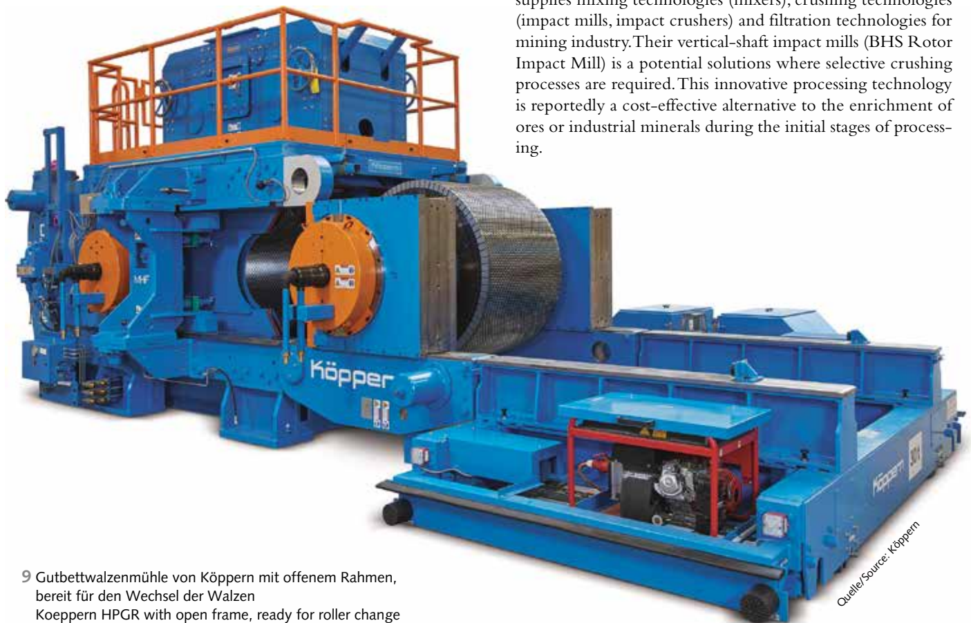
9 Gutbettwalzenmühle von Köppern mit offenem Rahmen, bereit für den Wechsel der Walzen Koeppern HPGR with open frame, ready for roller change

The company BHS-Sonthofen from Sonthofen/Germany supplies mixing technologies (mixers), crushing technologies (impact mills, impact crushers) and filtration technologies for mining industry. Their vertical-shaft impact mills (BHS Rotor Impact Mill) is a potential solutions where selective crushing processes are required. This innovative processing technology is reportedly a cost-effective alternative to the enrichment of ores or industrial minerals during the initial stages of processing.