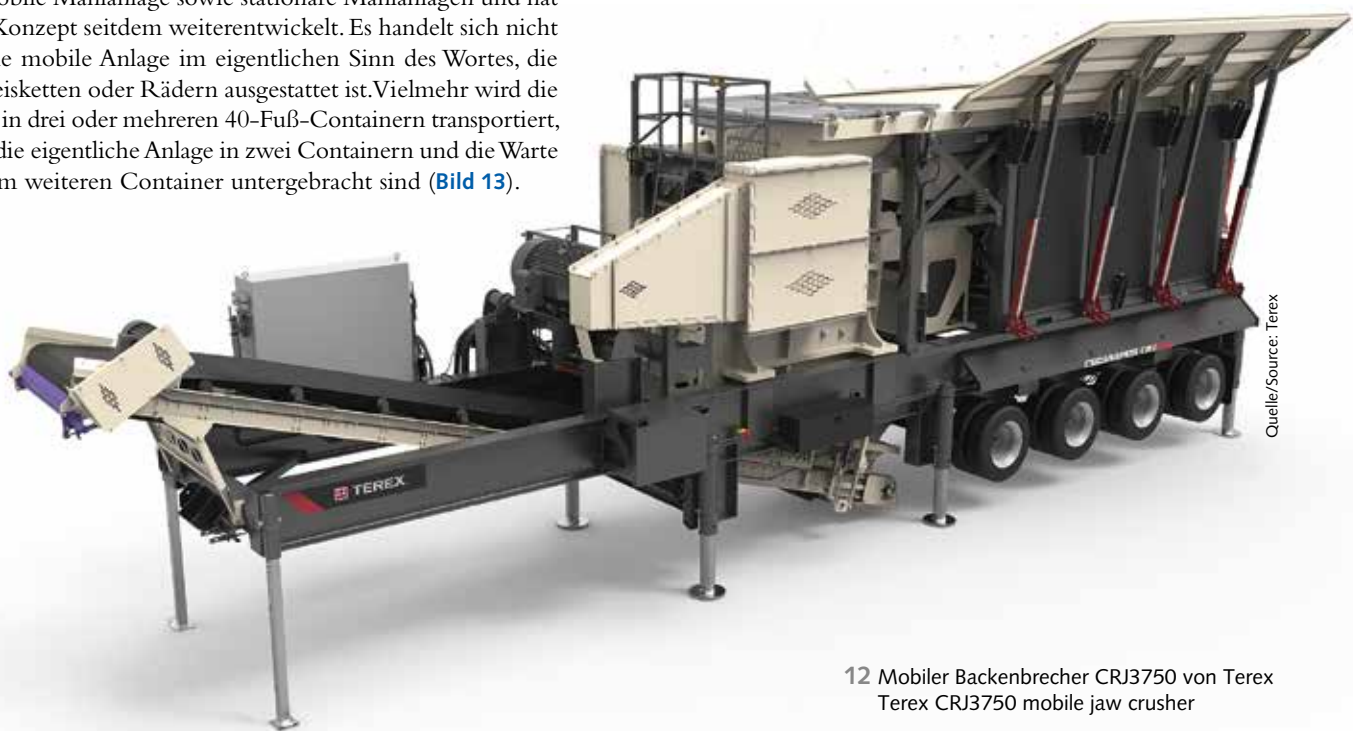
12 Mobiler Backenbrecher CRJ3750 von Terex Terex CRJ3750 mobile jaw crusher

The Sepro mill used together with of existing equipment is considered as a preferred option as these are used in industrial