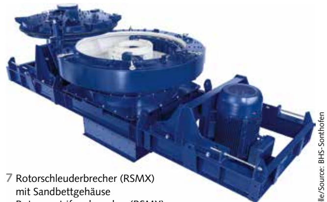
7 Rotorschleudrerbrecher (RSMX) mit Sandbettgehäuse Rotor centrifugal crusher (RSMX) with rock shelf housing

According to AC, their range of impact crushers (models PC 1060, PC 1, PC 3, PC 1375, PC 5 and PC 1610) is adapted to both primary and secondary crushing of soft to medium hard material. They claim that the position of the swing beams which carry the hammers allow for a wider gap than other manufacturers (and thus a larger feed size), permitting their impact crushers to act as primary crushers for softer rock.