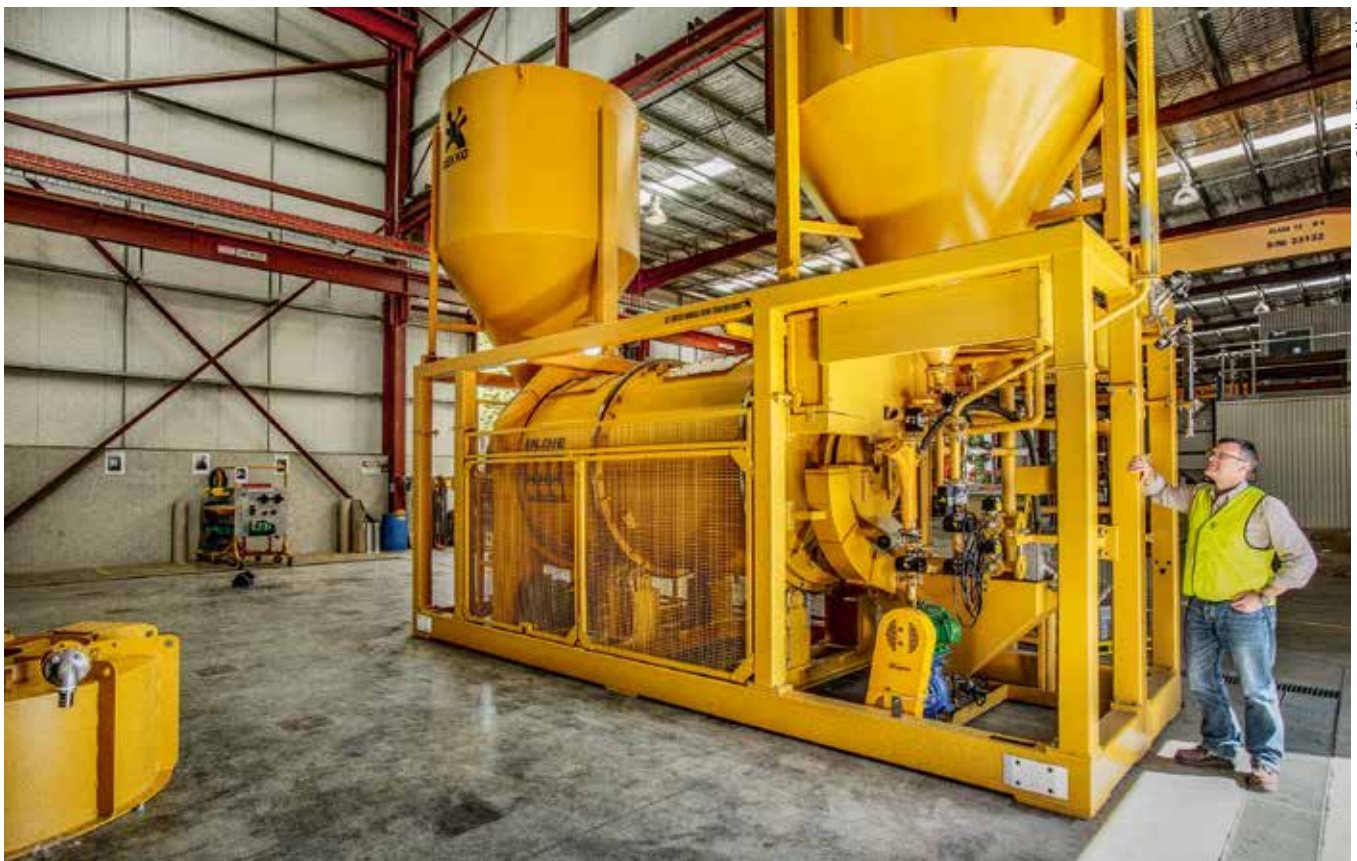
19 Inline-Laugenreaktor von Gekko • Gekko's in-line reactor

Froth flotation cells are manufactured by a variety of suppliers. The size of the cell chosen for a project is dependent on feed rates and residence times required, consequently there are a variety of cell sizes offered by the manufacturers. Designs vary between the manufacturers but all share the common methods of separation. The main suppliers in Europe are Metso, FLSmidth and Outotec. Metso have developed a mobile processing plant (part 3, as follows), however equipment supplied from other vendors could be used to construct similar plants.