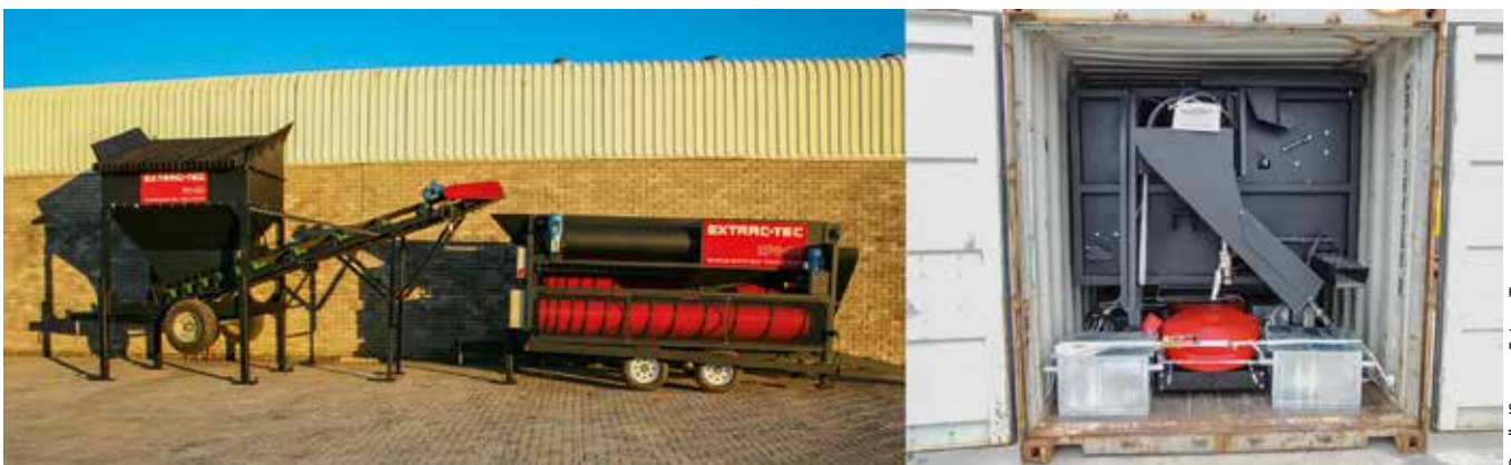
18 Mobile Schwerkraftanlage HPC-30 von Extrac-Tec • Extrac-Tec's HPC-30 mobile gravity unit

Agitated leaching is often performed on ground ores which are added to a mixing tank with water and an extractant (such as cyanide or acid) to recover the metal of interest. The pulp is mixed for a pre-determined time to allow the metal to be extracted from the solid to the liquid phase. The liquid phase (having been separated from the solids), containing the metal is then further processed to recover the metal. One of the primary design factors