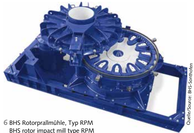
6 BHS Rotorprallmühle, Typ RPM BHS rotor impact mill type RPM

FLSmidth hat zudem eine modulare Rückfluss-Klassieranlage im Programm. Diese integrierte Lösung in Modultechnik basiert auf den REFLUX® Klassifikatoren (RC) von Ludowici, die dank einer Dichtesortiertechnik für Feinpartikel eine hohe laminare Scherleistung bieten. Jeder Modulbereich passt in einen 20-Fuß-Transportcontainer. Die Kombination dieser Bereiche oder Container erlaubt eine Anlagenkonfiguration nach verschiedenen und spezifischen Prozessanforderungen.