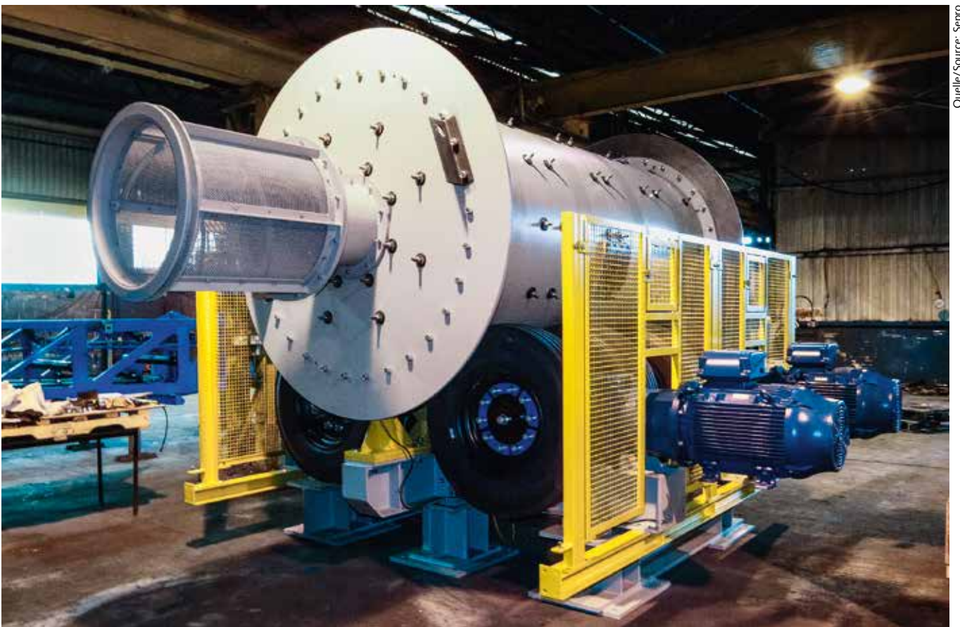
14 Sepro-Mühle mit Reifenantrieb, 1,8 x 3,6 m • Sepro 1.8 x 3.6m tyre drive mill

As an example of these types of separators, FLSmidth supply the Wemco® Heavy Media Separation. These are modular, relocatable and mobile available with either Drum or Cyclone modules. The WEMCO Heavy Media Drum Separator is a