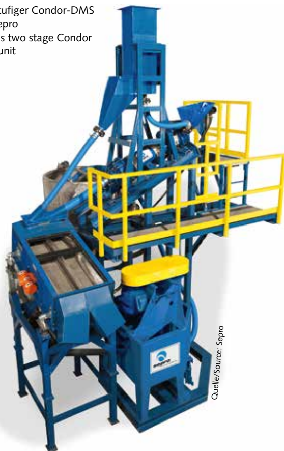
15 Zweistufiger Condor-DMS von Sepro Sepro's two stage Condor DMS unit