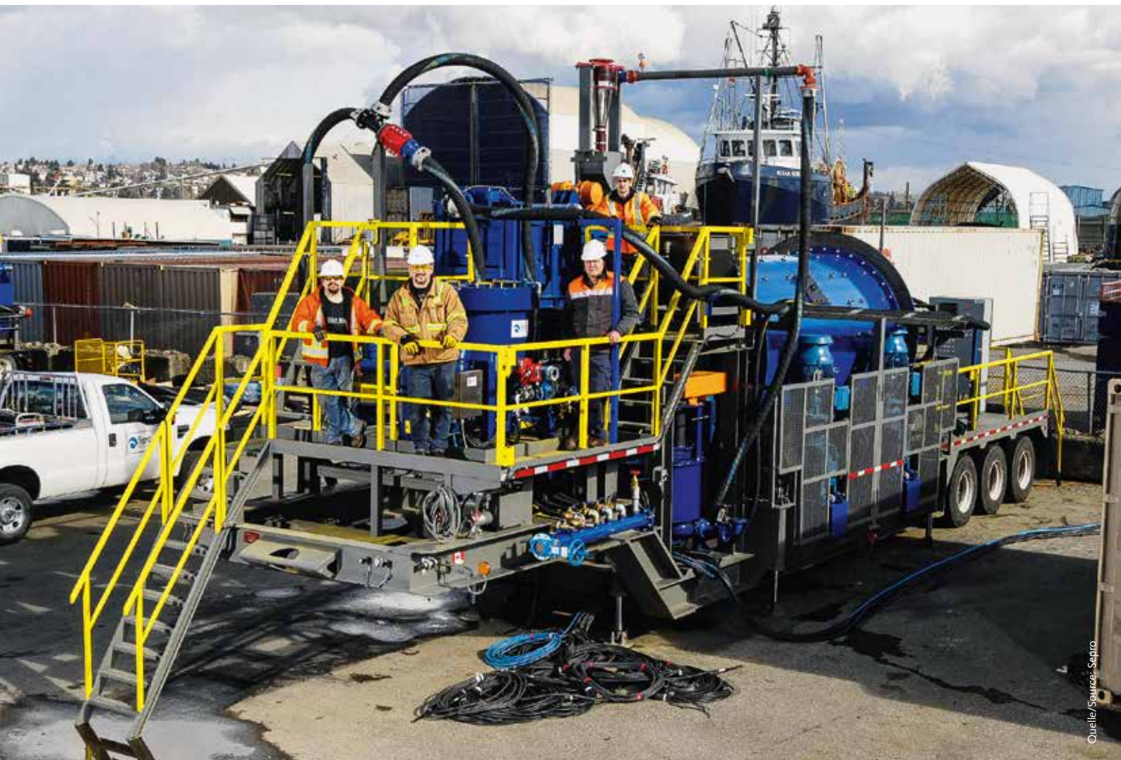
Mobile Anlage von Sepro • Mobile plant from Sepro

Summary: Part 2 of the report on mobile mineral processing equipment includes a description of typical processing equipment with focus given on European equipment suppliers and their corresponding mobile processing equipment for the specific process circuits – drawing upon worldwide practices.